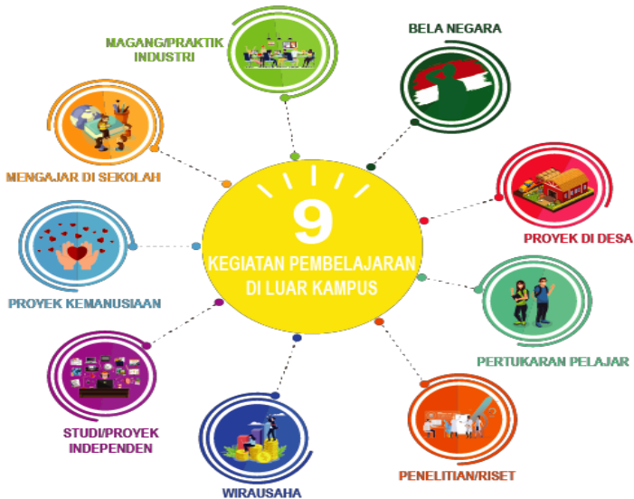
Gambar 1. Skema MBKM yang dapat dipilih oleh mahasiswa.

Berbagai bentuk kegiatan MBKM dalam hal ini belajar di luar perguruan tinggi yang bisa dilakukan oleh mahasiswa Prodi Fisika, antara lain :